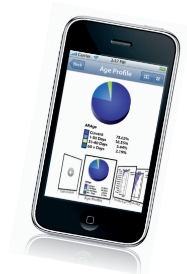
QlikView für das iPhone